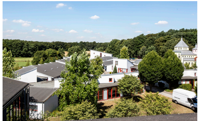
Idylle in Selbeck - das Fliedner-Dorf.